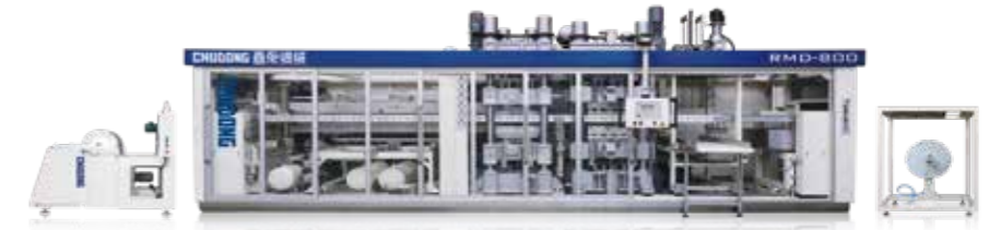
SL-1220A + SL520 | 亞規系統-壓空成型機 / 塑料包裝-自動壓空成型解決方案與技術